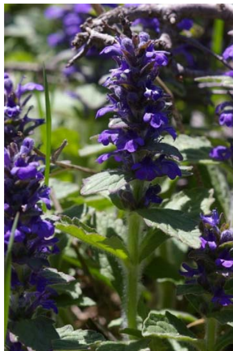
Ajuga genevensis L. ( Bugle de Genève )