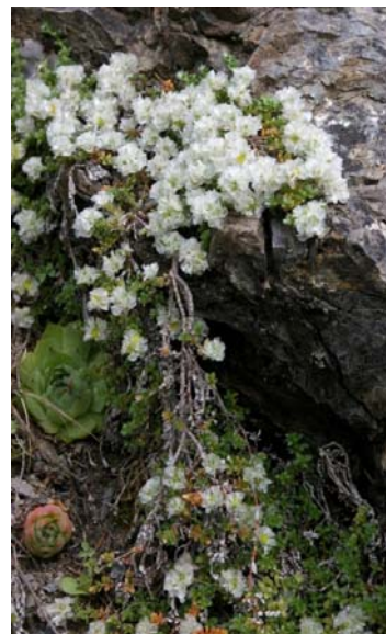
Paronychia kapela ( Hacq. ) A.Kern. ( Paronyque imbriquée )