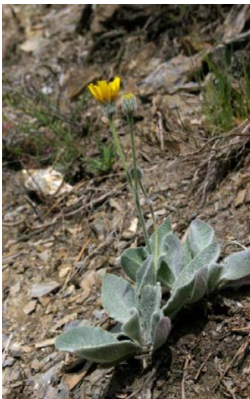
Hieracium tomentosum L. ( Epervière laineuse )