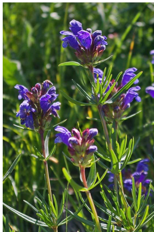
Dracocephalum ruyschiana L. ( Dracocéphale de Ruysch )