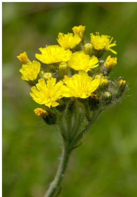
Hieracium cymosum L. ( Epervière en cyme )