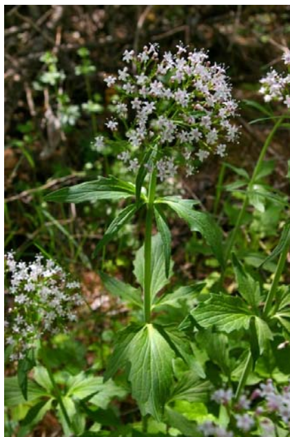
Valeriana tripteris L. ( Valériane à trois folioles )