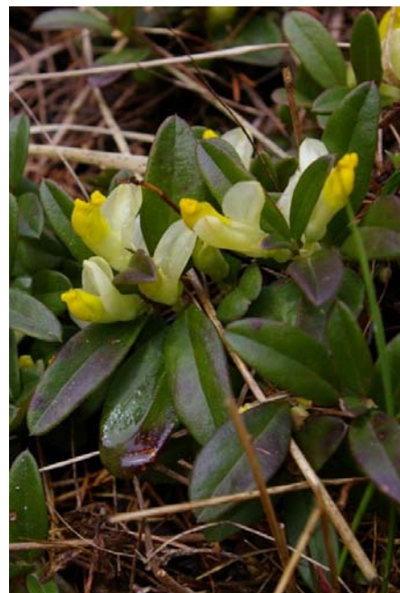
Polygala chamaebuxus L. ( Polygala petit buis )