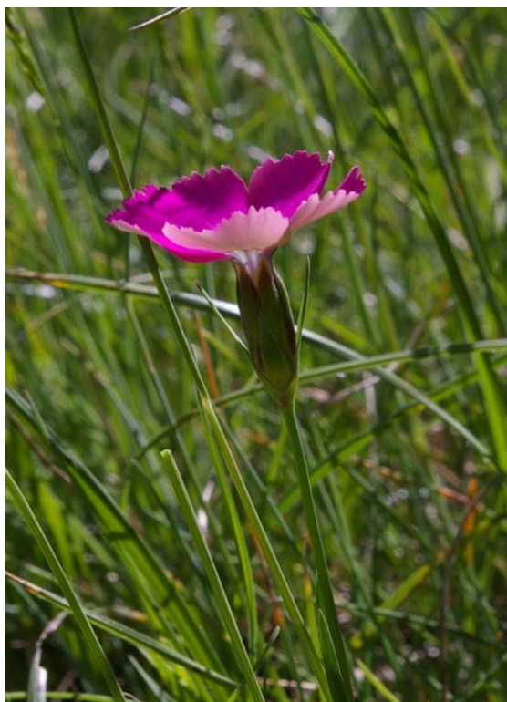
Dianthus pavonius Tausch ( Oeillet négligé )