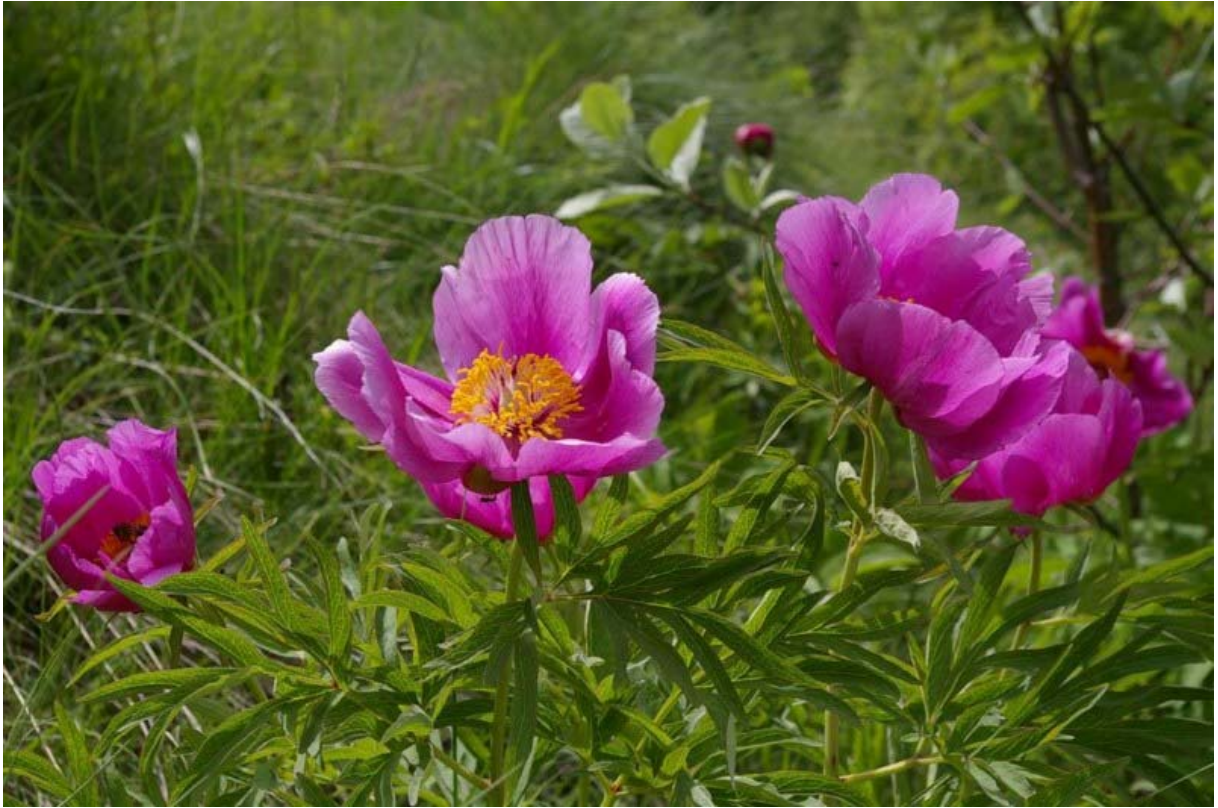
Paeonia officinalis L. subsp. huthii Soldano ( Pivoine )